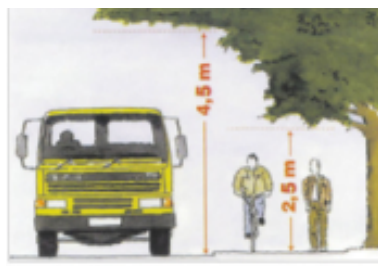
Tomt intill gata

Ligger ditt hus vid en gata bör du se till att dina växter inte är högre än 70 cm över gatan i en sikttriangel som sträcker sig minst 10 meter åt vardera hållet. Detta gäller även om ditt hus ligger vid en gång- eller cykelväg.