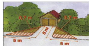
Du som har utfart mot gata

Vid utfarten bör du se till att dina växter inte är högre än 70 cm inom markerad sikttriangel. Sikten ska vara fri minst 5 meter från gatan eller gångbanan.